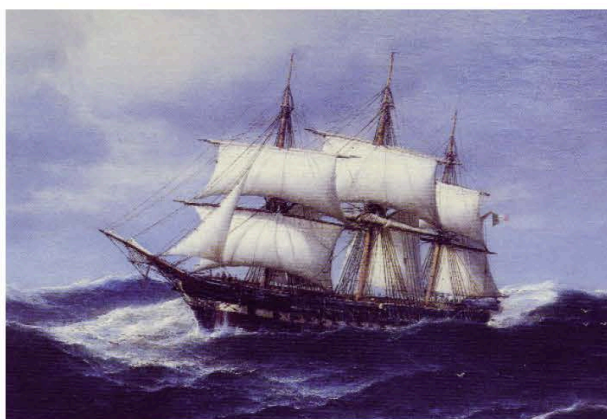
Regia Marina - La Corvetta Euridice, E. De Martino (1863)

Un album di ricordi, una eccezionale raccolta documentaria ed iconografica.